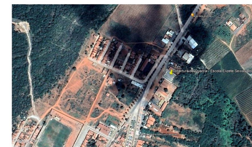
PLANTA GEORREFERENCIADA SEM ESCALA