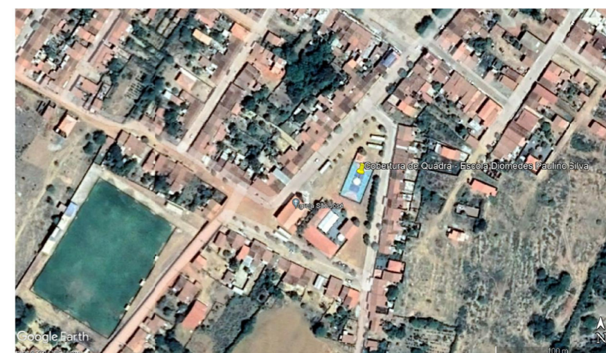
PLANTA GEORREFERENCIADA SEM ESCALA