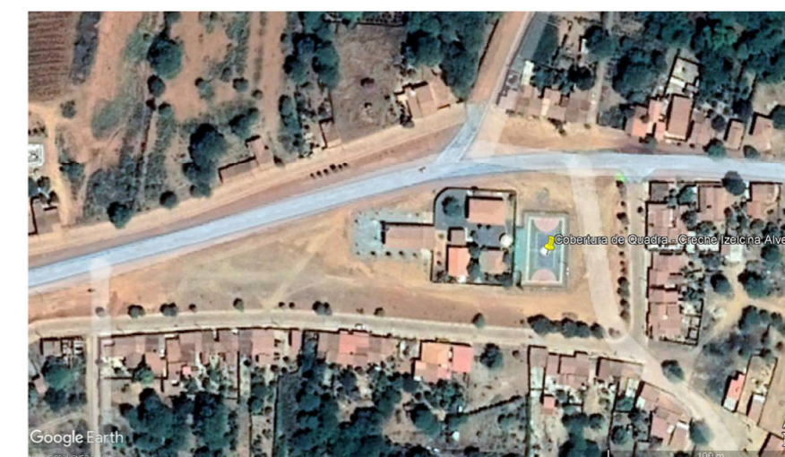
PLANTA GEORREFERENCIADA SEM ESCALA