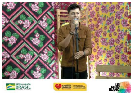
GABRIEL DINIZ FREITAS (Cantor)