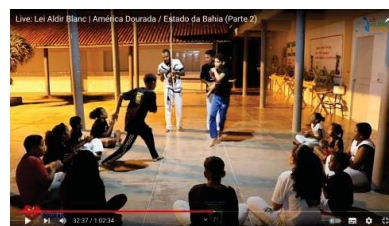
Live: Lei Aldir Blanc | América Dourada / Estado da Bahia (Parte 2)